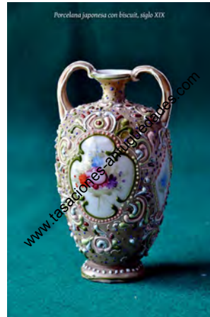
Porcelana japonesa con biscuit, siglo XIX