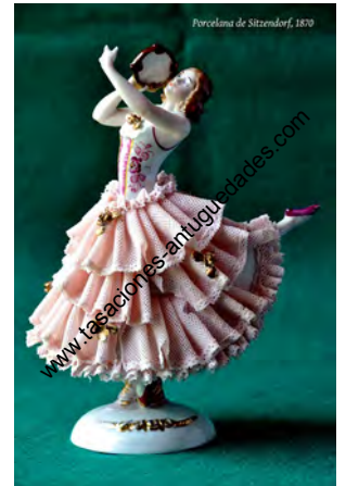
Porcelana de Sitzendorf, 1870