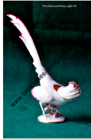
Porcelana austriaca, siglo XX