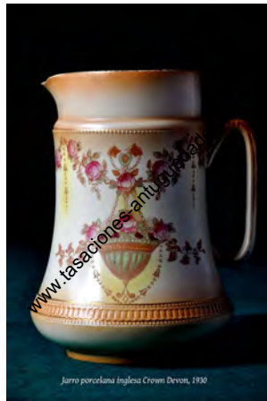
Jarro porcelana inglesa Crown Devon, 1930