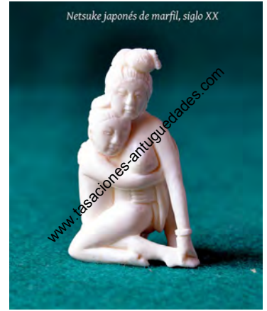
Netsuke japonés de marfil, siglo XX