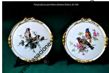
Pareja placas porcelana alemana Kaiser, de 1906