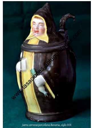
Jarra cerveza porcelana Bavaria, siglo XIX