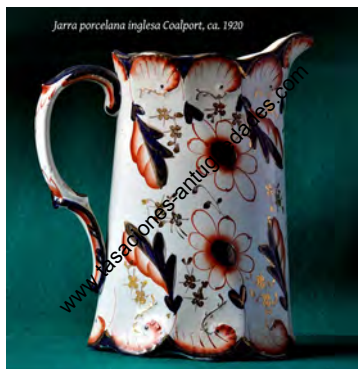
Jarro porcelana inglesa Coalport, ca. 1920