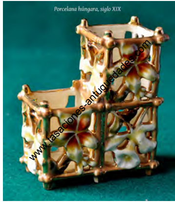
Porcelana húngara, siglo XIX