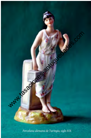
Porcelana alemana de Turingia, siglo XIX