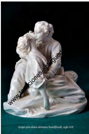
Grupo porcelana alemana Rudolfsbad, siglo XIX