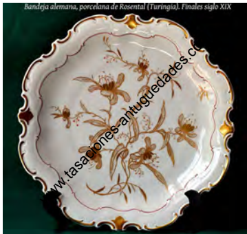
Bandeja alemana, porcelana de Rosenthal (Turingia), Finales siglo XIX