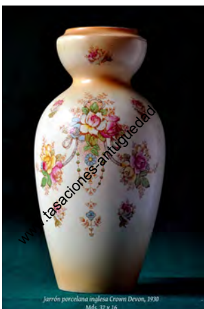
Jarrón porcelana inglesa Crown Devon, 1930