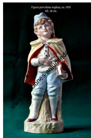
Figura porcelana inglesa, ca. 1910