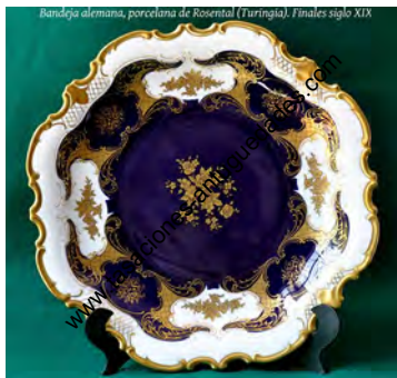
Bandeja alemana, porcelana de Rosenthal (Turingia), Finales siglo XIX