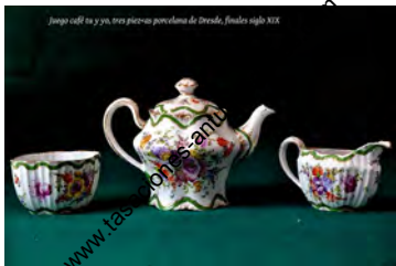
Jarraj café sa y sa, tres piezas porcelana de Dresde, finales siglo XIX