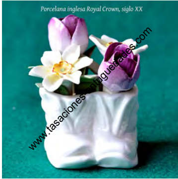
Porcelana inglesa Royal Crown, siglo XX