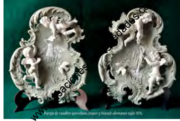
Pareja de cuadros porcelana Jingpi y bisnui alemanes siglo XIX.