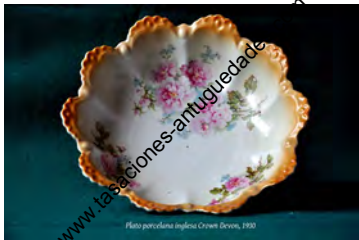
Plato porcelana inglesa Crown Devon, 1900