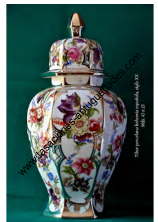
Tibor porcelana bohemia española, siglo XX