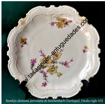
Bandeja alemana, porcelana de Reichenbach (Turingia), Finales siglo XIX