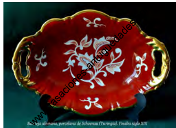
Plato alemana, porcelana de Schwanau (Turingia), Finales siglo XIX