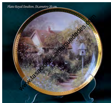
Plato Royal Doulton. D, metro 30 cm