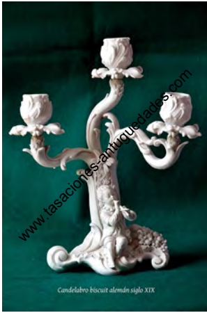
Candelabro biscuit alemán siglo XIX