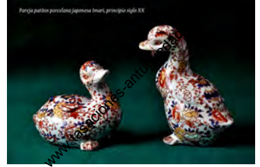
Pareja patitos porcelana japonesa Imari, principios siglo XX