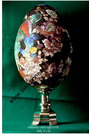
Cloisonné (China) siglo XVIII. Mda. 51 x 26