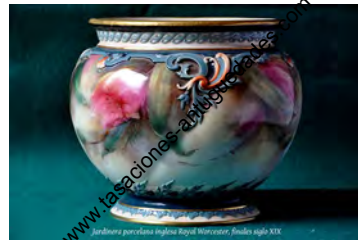
Jarriera porcelana inglesa Royal Worcester, finales siglo XIX