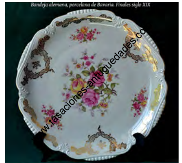
Bandeja alemana, porcelana de Bavaria, Finales siglo XIX