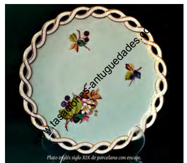
Plato Infants siglo XIX de porcelana con encaje