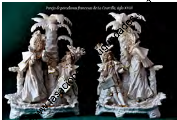
Pareja de porcelana francesa de La Grenolle, siglo XIX