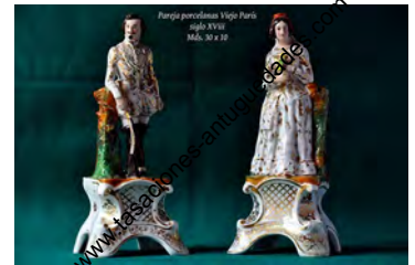
Parja porcelana Vigo Paris 1840-1850