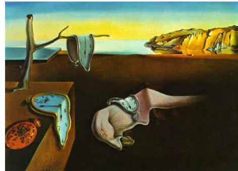
להתפעם מסלבדור דאלי