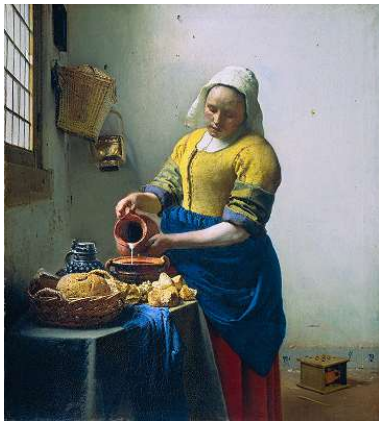
מ- "מוזגת החלב" של ורמר