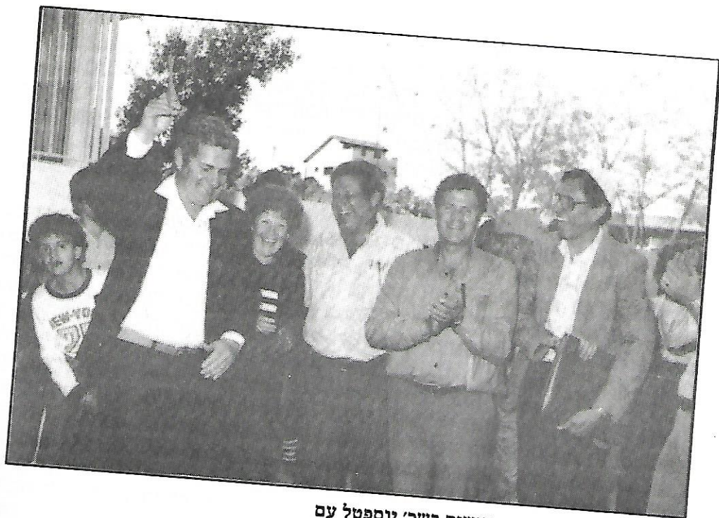
תמונה מחנוכת מועדון קשישים בשכ' יוספטל עם אנשי הקהילה המאמצת.