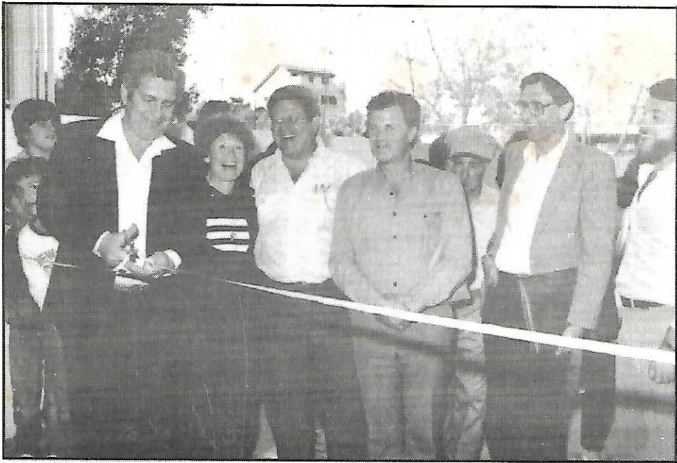
Dedication of the Pensioners' Club, Shikun Yoseftal, together with members of the adopting community from Florida