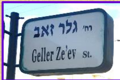
רחוב גלר במרכז העיר

אליהו אוסטשינסקי ז"ל (1870-1951) עלה ארצה בשנת 1891. קנה חלקת קרקע באדמות כפר סבא, ועם הקמת היישוב התיישב והקים בה את ביתו. במשך שנים רבות שימש ראש הוועד במושבה. בשנת 1937 מונה לתפקיד ראש המועצה המקומית הראשונה, ושימש בתפקידו עד שנת 1939.