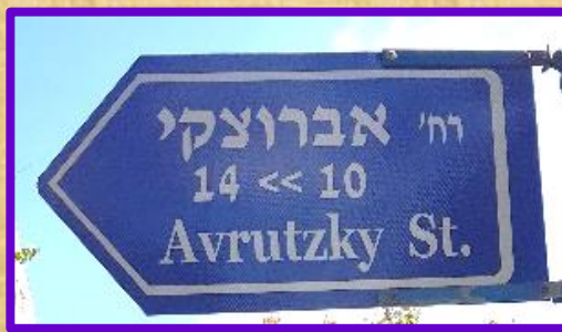
רחוב אברוצקי בשכונה הירוקה

יואל אברוצקי ז"ל (1916-1978) עלה ארצה בשנת 1910. היה בין הראשונים שהקימו את כפר סבא. הוא בנה בה את ביתו ונטע בה כרם שקדים.