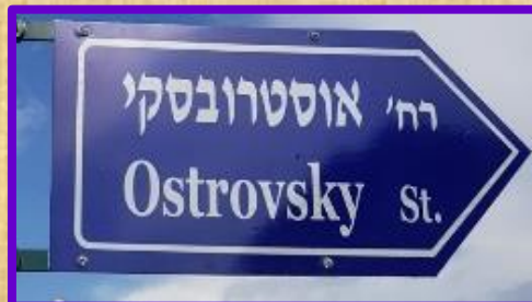
רחוב אוסטרוובסקי בשכונה הירוקה

יואל אברוצקי ז"ל (1916-1978) עלה ארצה בשנת 1910. היה בין הראשונים שהקימו את כפר סבא. הוא בנה בה את ביתו ונטע בה כרם שקדים.