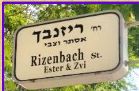
רחוב ריזנבך בשכונה הירוקה

אברהם קמינסקי ז"ל (1882 – 1966) נמנה עם אנשי העלייה השנייה שהגיעו לפתח-תקוה בשנת 1908. נתן ידו לייסוד כפר-סבא. בהמשך בנה ביתו ב"עמק-השבעה" בשכנות למחנה-יהודה. עסק בחקלאות ובעבודה. היה איש חרוץ, צנוע ומסור לעבודתו, וחבר בארגון ה"הגנה".