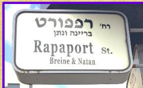
רחוב רפפורט בשכונה הירוקה

צבי אריה ריזנבך ז"ל (1880 – 1962) בגיל 19 עלה לארץ, התיישב בירושלים ושיקע עצמו בלימוד בישיבות. הצטרף לקבוצת החרדים הירושלמית שקנתה חלקות קרקע בכפר סבא. נטע כרם במו ידיו ולא נטש את אדמתו, אף לא בשנות המלחמה העולמית הראשונה.