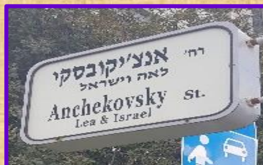
רחוב אנצ'יקובסקי בשכונה הירוקה