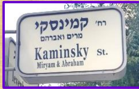
רחוב קמינסקי בשכונה הירוקה

אברהם קמינסקי ז"ל (1882 – 1966) נמנה עם אנשי העלייה השנייה שהגיעו לפתח-תקוה בשנת 1908. נתן ידו לייסוד כפר-סבא. בהמשך בנה ביתו ב"עמק-השבעה" בשכנות למחנה-יהודה. עסק בחקלאות ובעבודה. היה איש חרוץ, צנוע ומסור לעבודתו, וחבר בארגון ה"הגנה".