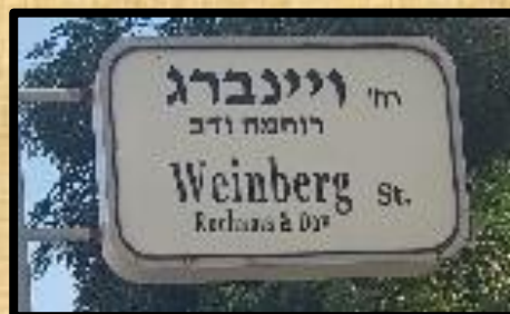
רחוב ויינברג בשכונה הירוקה