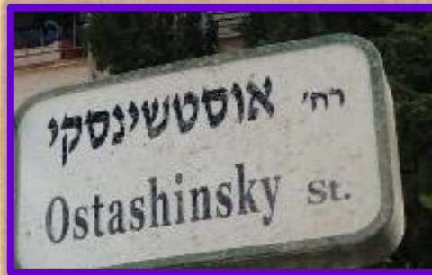
רחוב אוסטשינסקי במרכז העיר

אליהו אוסטשינסקי ז"ל (1870-1951) עלה ארצה בשנת 1891. קנה חלקת קרקע באדמות כפר סבא, ועם הקמת היישוב התיישב והקים בה את ביתו. במשך שנים רבות שימש ראש הוועד במושבה. בשנת 1937 מונה לתפקיד ראש המועצה המקומית הראשונה, ושימש בתפקידו עד שנת 1939.