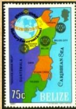
הבול עם המפה שנגנז

במאס 1981 הסכימו בריטניה וגואטמלה לתוכנית להענקת עצמאות למושבה המרכז אמריקאית בליז (לשעבר הונדורס הבריטית). באותו אביב, הבלייזים ערכו הפגנות אלימות על תנאי ההסכם, שלדעתם נתנו יותר מדי וויתורים לגואטמלה. בעיצומה של התסיסה הפוליטית, ב-30 במרץ, הוציאה בליז סט של שמונה בולים לציון 75 שנה לרוטרי. אבל נראה שאחד מהם הציג מפה של בליז יחד עם לוגו יום השנה ושלוש סמלי רוטרי, נתן את מחוז קאיו בבליז לגואטמלה, בשל הצבעים הדומים שתחמו אותם. שירות הדואר משך את כל הסדרה והרס את חותמת המפה. "כיום זה שווה מעל 1,200 דולר - אם אתה יכול למצוא אותם". שאר הבולים בסדרה הונפקו מחדש במאי 1981, ושוב בספטמבר, הפעם הודפסו בתאריך עצמאותה של בליז.