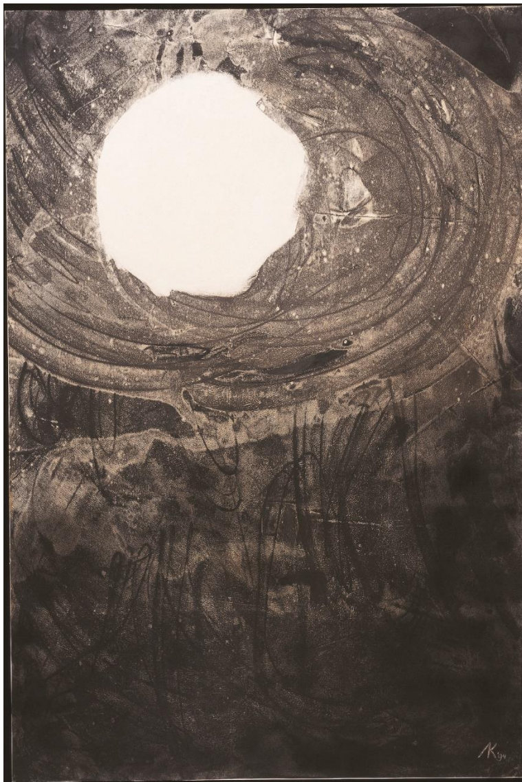
© serie Psalmen - Anneke Kaai

Psalm 130: 1 en 6a | Uit de diepten roep ik tot U, o HEERE. Mijn ziel wacht op de Heere, meer dan de wachters op de morgen. – ‘De dichter bevindt zich in een diepe crisis, wat gesymboliseerd wordt door een put. Hij is omgeven door angst en duisternis. De roep klinkt naar boven: “Here, hoor mijn stem.” Hij verlangt naar het Licht, de Here God, zoals de wachters verlangen naar de morgen.’