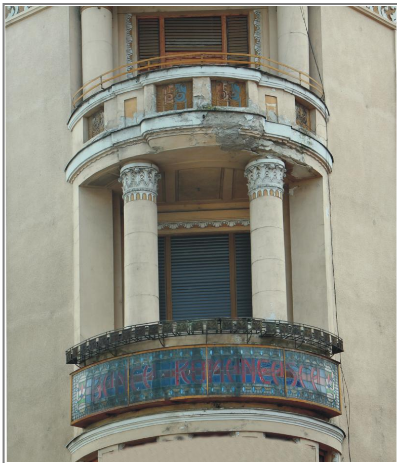
Panou publicitar color din anii '30 al Băncii Românești situat sub balconul cu stâlpi decorativi din colțul clădirii