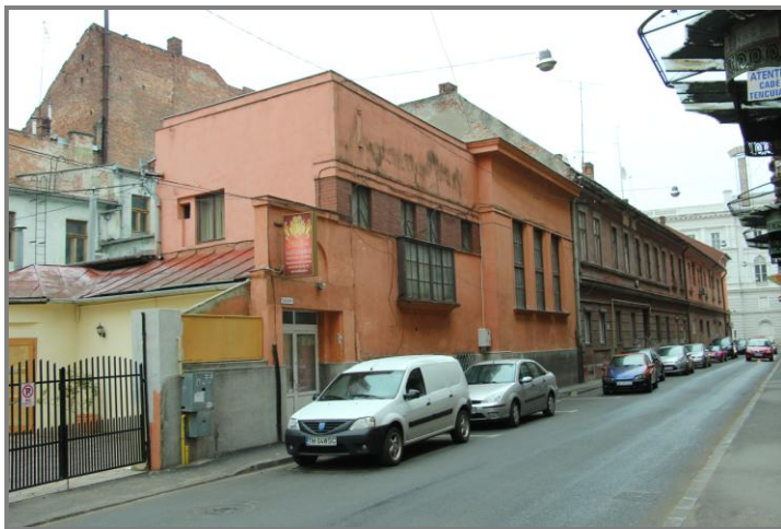
Vecinii palatului Bohus de pe strada Zrinyi (Vasile Goldiș): Clubul Llyod și fosta cantină socială

Comercializarea publicației care era una semnificativă și din punct de vedere al publicității aducea venituri frumoase și odată cu acestea creștea și lista susținătorilor cauzei (Lanevschi, pag.106).