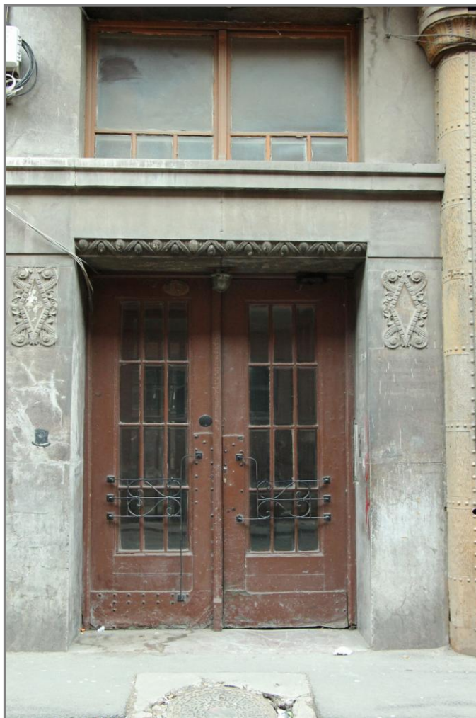
Una dintre porțile decorate dinspre strada Zrinyi (astăzi Vasile Goldiș)