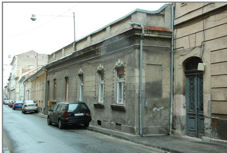
Sediul fostului Club sportiv Hakoah

Culorile clubului au fost reprezentate de către mai mulți campioni naționali la tenis de masă, gimnastică, natație și atletism. Avea și o echipă de fotbal destul de populară. Clubul sportiv a fost desființat în 1940.