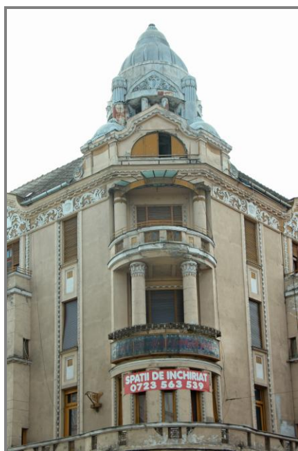
Cupola și balconul caracteristice secesionului vienez