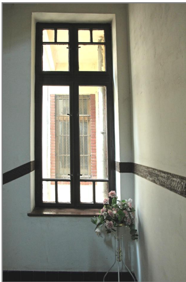
Fereastra scării care redă atmosfera începutului de secol XX