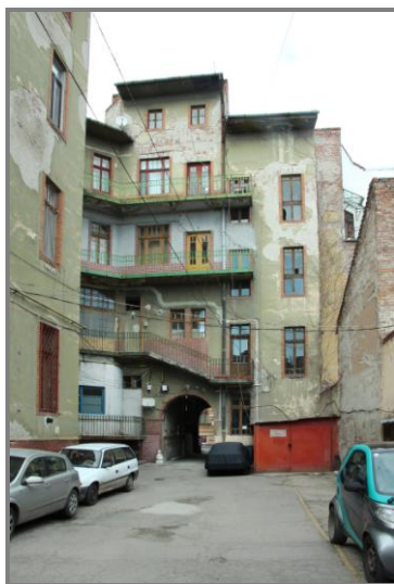
Vedere spre lumea interioară a palatului, dinspre curte

La fel s-a întâmplat și cu numele străzii; s-a schimbat odată cu orientările politice: Zrínyi, Anatole France, Vasile Goldiș. Mica stradă care păstra numele fostului primar Atzél Péter (1867-1871) a fost redenumită la rândul ei după numele generalului francez Berthelot după 1920 (acesta a trecut prin Arad în decembrie 1918) iar în 1948 a fost absorbită de Bulevardul Republicii, devenit Bulevardul Revoluției după 1989.