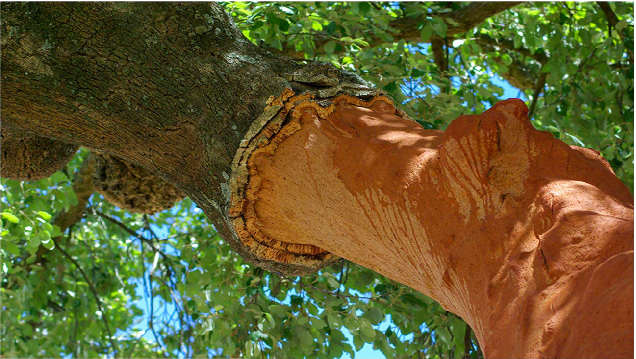
Fig.1 Cork Oak

A Espírito Santo Cortiças (ESC) desenvolve a sua atividade de produção e acabamento de rolhas de cortiça naturais para vinhos e rolhas naturais com cápsulas de madeira para bebidas espirituosas.