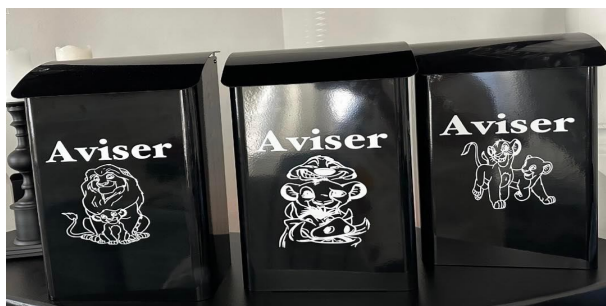
7 A-B-C-D-E (Løvenes konge, og Mikke og Minni)