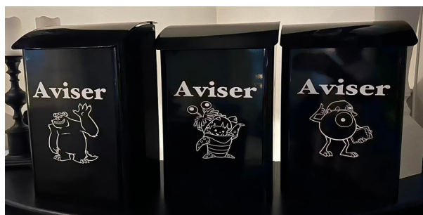
Benveien (Monster Inc)