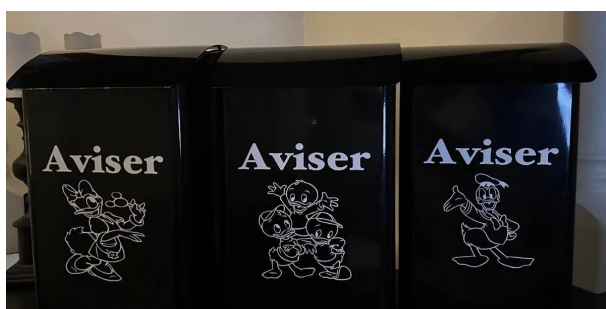
9 A-B-C-D-E (Donald og Minions)

Vi har byttet ut alle postkassene til aviser ute da noen ikke hang fast på veggene lenger, og mange manglet bunn og var ikke pene. De er nå byttet ut med svarte postkasser med Disneymotiv.