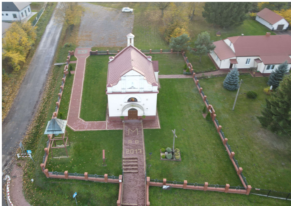
Rys. 1. Kościół pw. Matki Bożej Częstochowskiej w Chmielu.