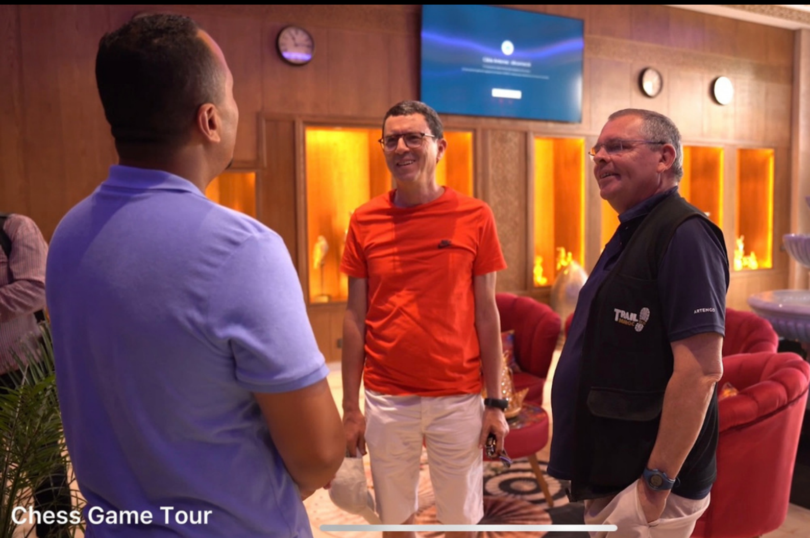
Chess Game Tour