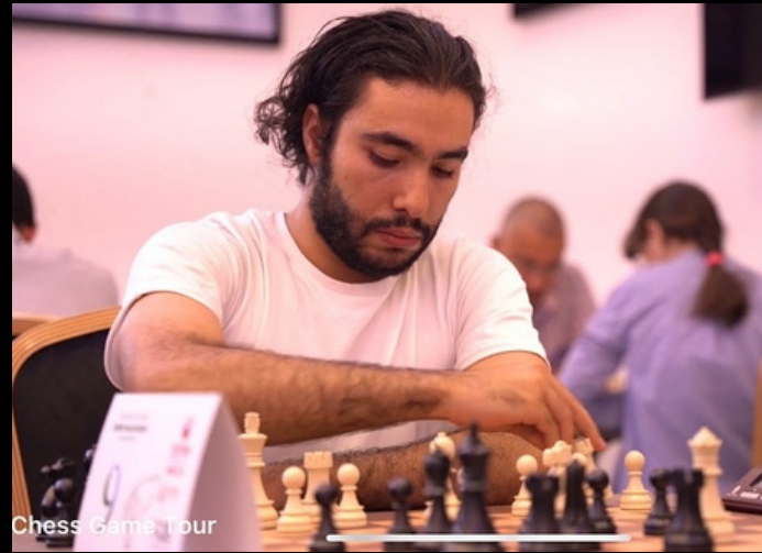
Chess Game Tour