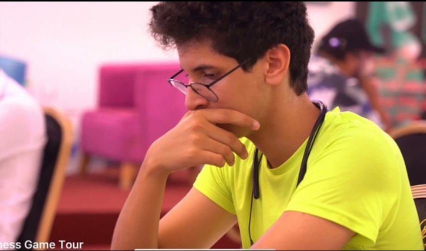
Chess Game Tour