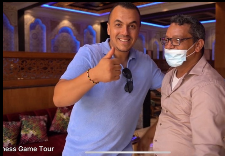
Chess Game Tour