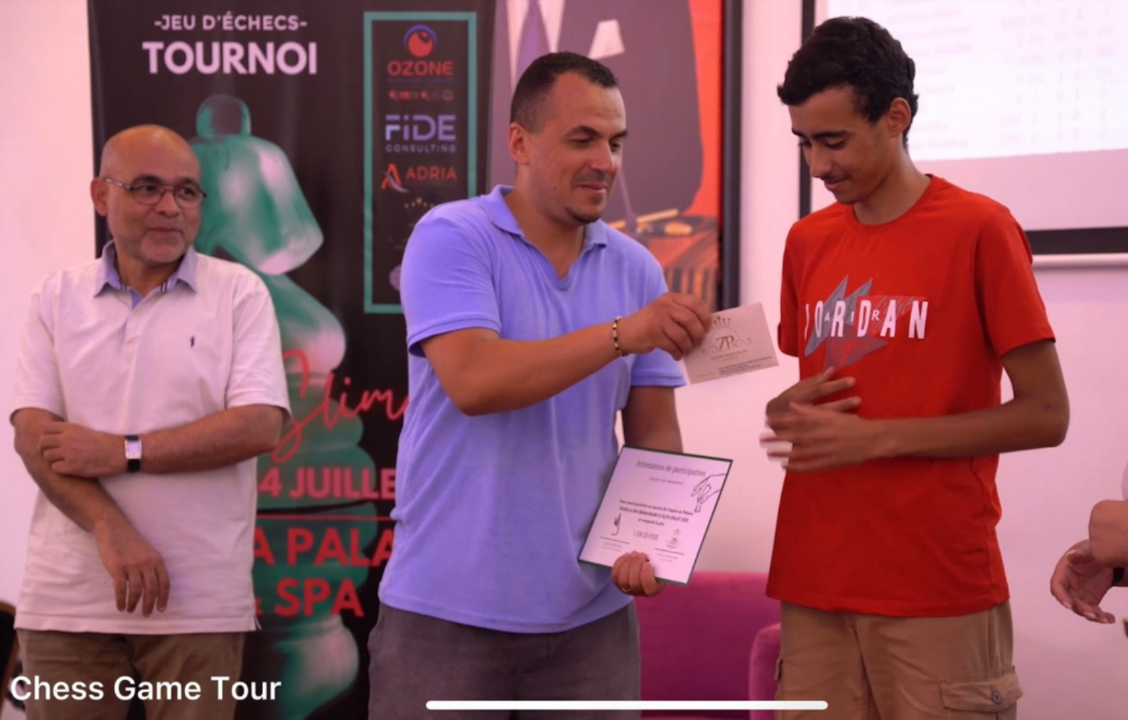
Chess Game Tour