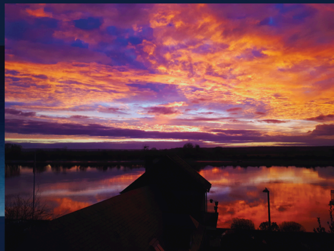
Moment to Moment Voyage intérieur à la lumière d'Orion