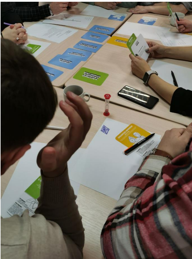
Блок «Совещания с сотрудниками» в игротренинговой программе для сети салонов «Модус Керамика»

Во время этого занятия участники освоят не только в теории, но и на практике: