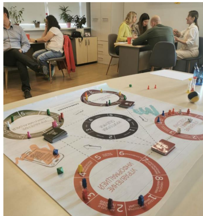
Блок «Личная эффективность руководителя» в игротренинговой программе для менеджеров проектной компании «ПМ ТЕХ»

А также тренажер The Leader показывает один из самых простых, приобретающих популярность, но все еще не очевидных путей развития лидера – повышение личной эффективности через правильные привычки work-life balance и well being.