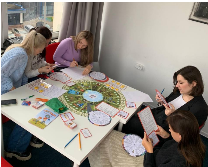
Обучающая игра для сотрудников бэк-офиса ОМА