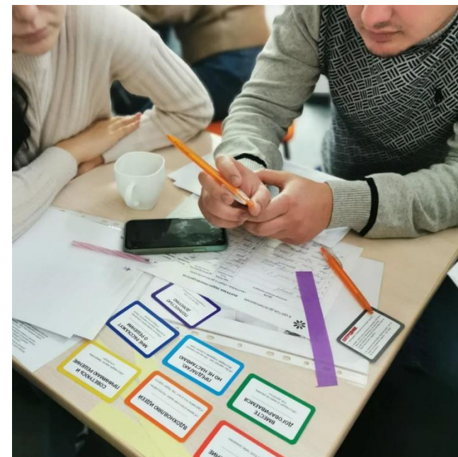
Блок «Делегирование» в игротренинговой программе для сети салонов «Модус Керамика»