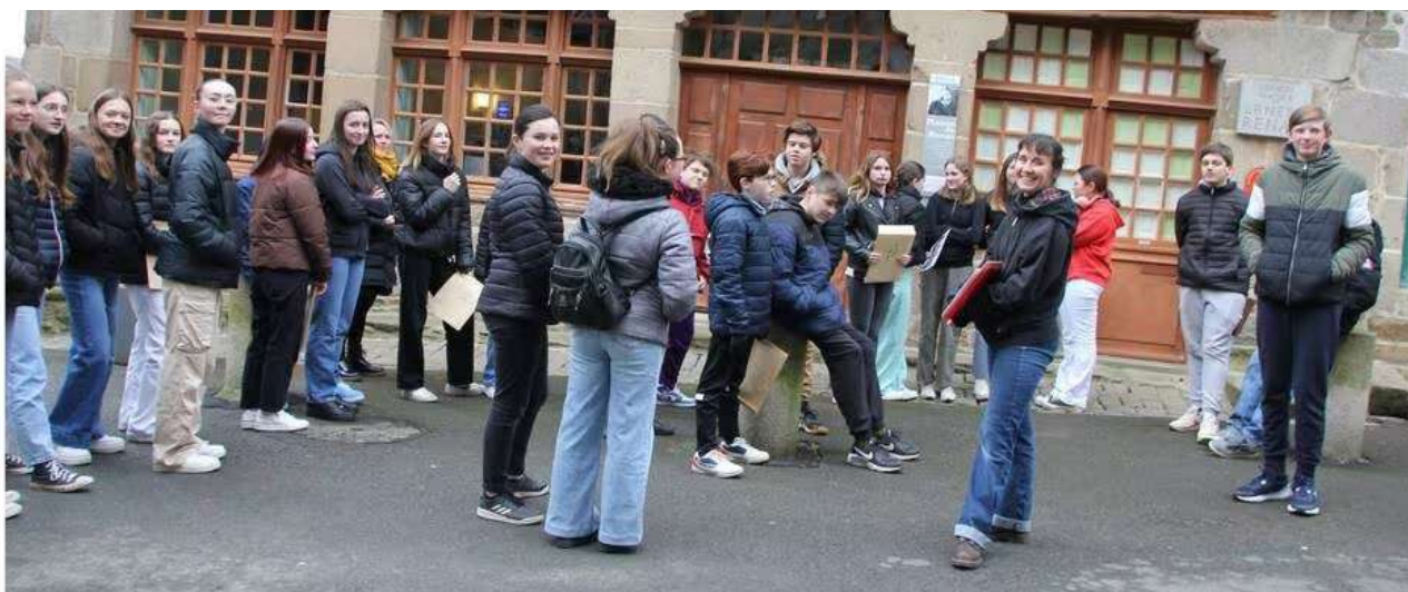
Sur les traces d'Ernest Renan avec les élèves de 4ème du collège Ernest Renan

La Cheap Cie est par ailleurs en contact avec les Archives Départementales de Saint Brieuc en vue de créer une collaboration de longue durée pour mettre en voix et en scène les documents patrimoniaux.