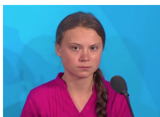
GRETA THUNBERG How dare you 2019