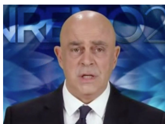
MAURIZIO CROZZA Festival di Sanremo 2017