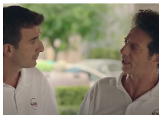
FICARRA E PICONE L'ora legale 2017