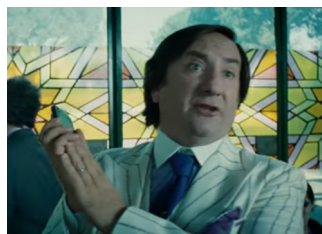
ANTONIO ALBANESE Qualunque 2011