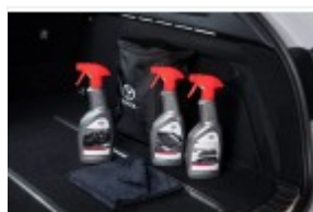
Zestaw kosmetyków samochodowych Toyota (PZWIG-OKIT1-00)