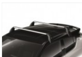
Bagażnik dachowy (do 75 kg) (PW301-10005)

Polecane akcesoria niewliczone do powyższej kalkulacji