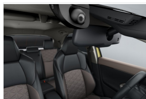
Widerejestrator C-HR (WIDEO_CHR)