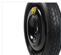
Koło dojazdowe (KOŁO)