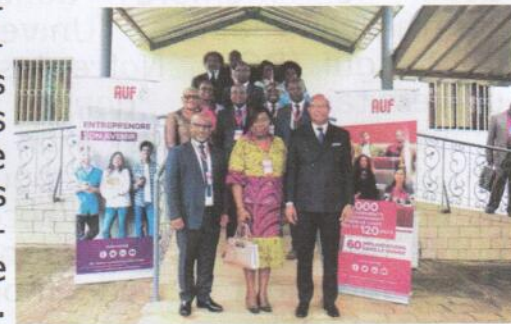
Photo de famille de tous les membres du CREES ayant inauguré le CEF de Libreville

les questions d'ouverture au monde socio-économique, d'employabilité et d'entrepreneuriat. Ainsi, la CREES a pour objectif de faire la synthèse et d'assurer la complémentarité de ces deux missions au niveau de chacune des dix régions administratives de l'AUF dans le monde. Comme mentionné dans les nouveaux statuts, la CREES est composée de : • 2/3 des membres issus du milieu universitaire et scientifique en lien avec le CS ; • 1/3 des membres issus du milieu socio-économique en lien avec le CES. Le rapprochement et la collaboration étroite