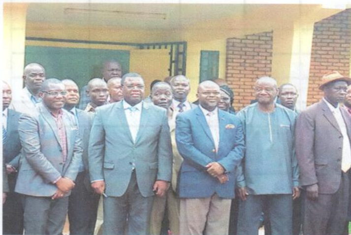
Photo de famille avec le premier ministre de l'enseignement supérieur au premier rang, le PF SYSSA MAGALE

A GUTSCHOOL, à la fin du semestre juste avant les délibérations, tous les étudiants doivent aller sur le site e-learning muni de leur mot de passe pour faire les évaluations de tous les modules de ce semestre sur la base de modèle de questionnaire ci-dessous ci-après à la page 8.