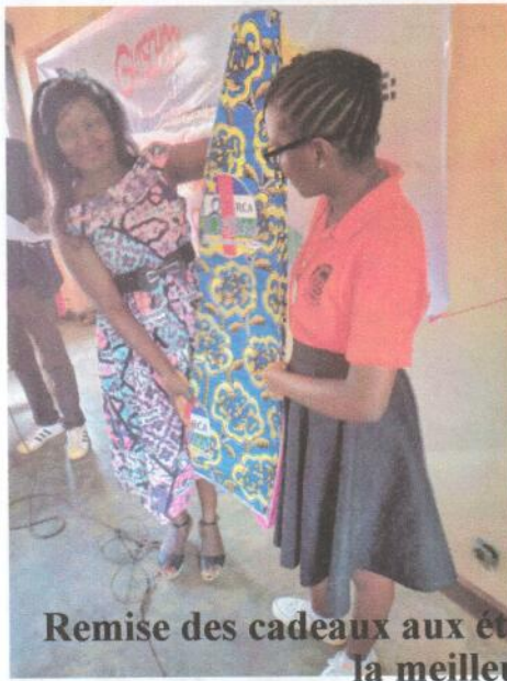
Remise des cadeaux aux étudiantes pour le concours de la meilleure citation