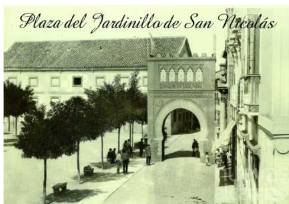
Teatro Principal, demolido a finales de los años 20

La antigua iglesia era muy grande y en su torre estaba colocada la campana del Cabildo. Cerrada al culto estuvo bastantes años deshabitada, instalándose allí a fines del siglo XVIII unas escuelas de gramática y en 1832 se empezaron a representar comedias en el edificio, convirtiéndolo el Ayuntamiento en un teatro tras grandes reformas.