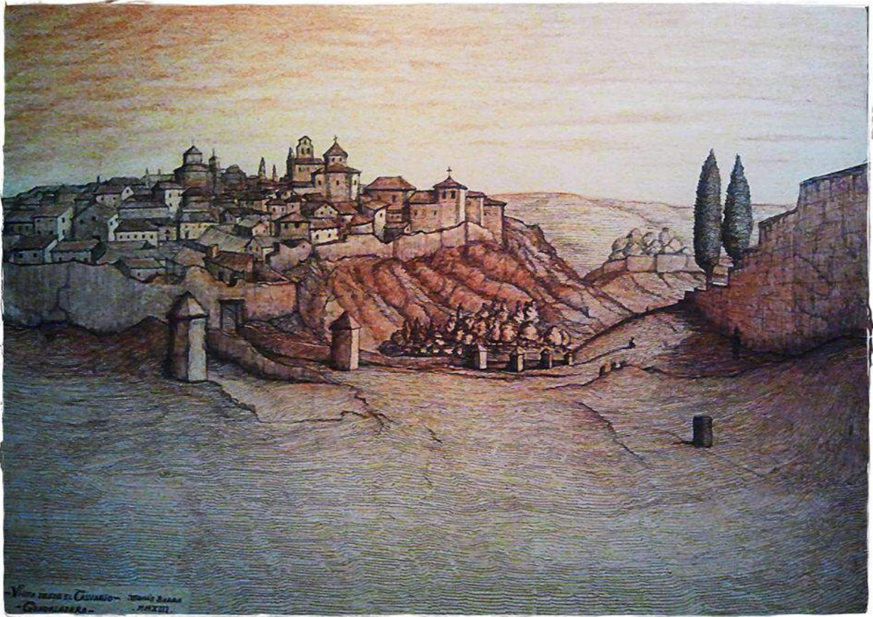
Convento y Portillo de San Antonio, imagen idealizada de Tomás Barra