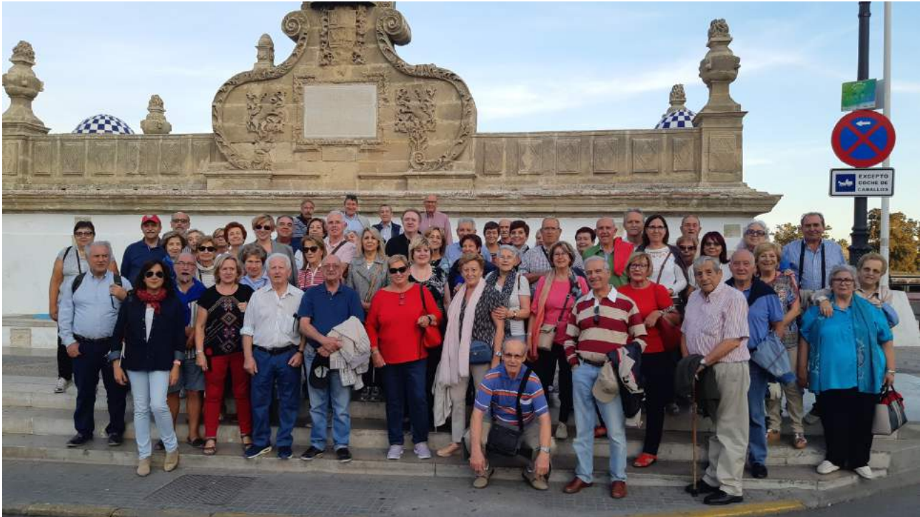
Puerto de Santa María