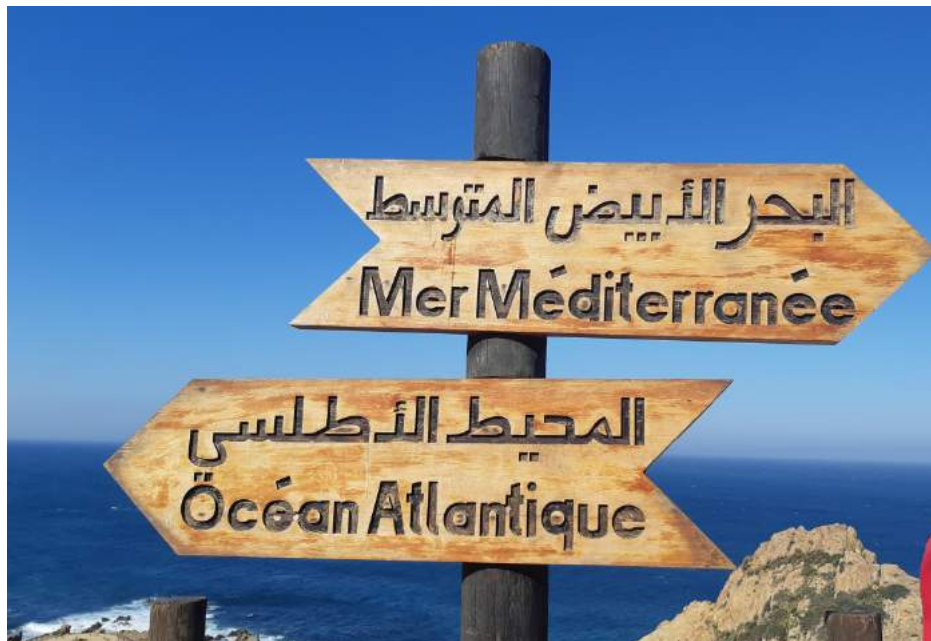
Tánger, lugar donde se encuentran el mar Mediterráneo y el oceano Atlántico