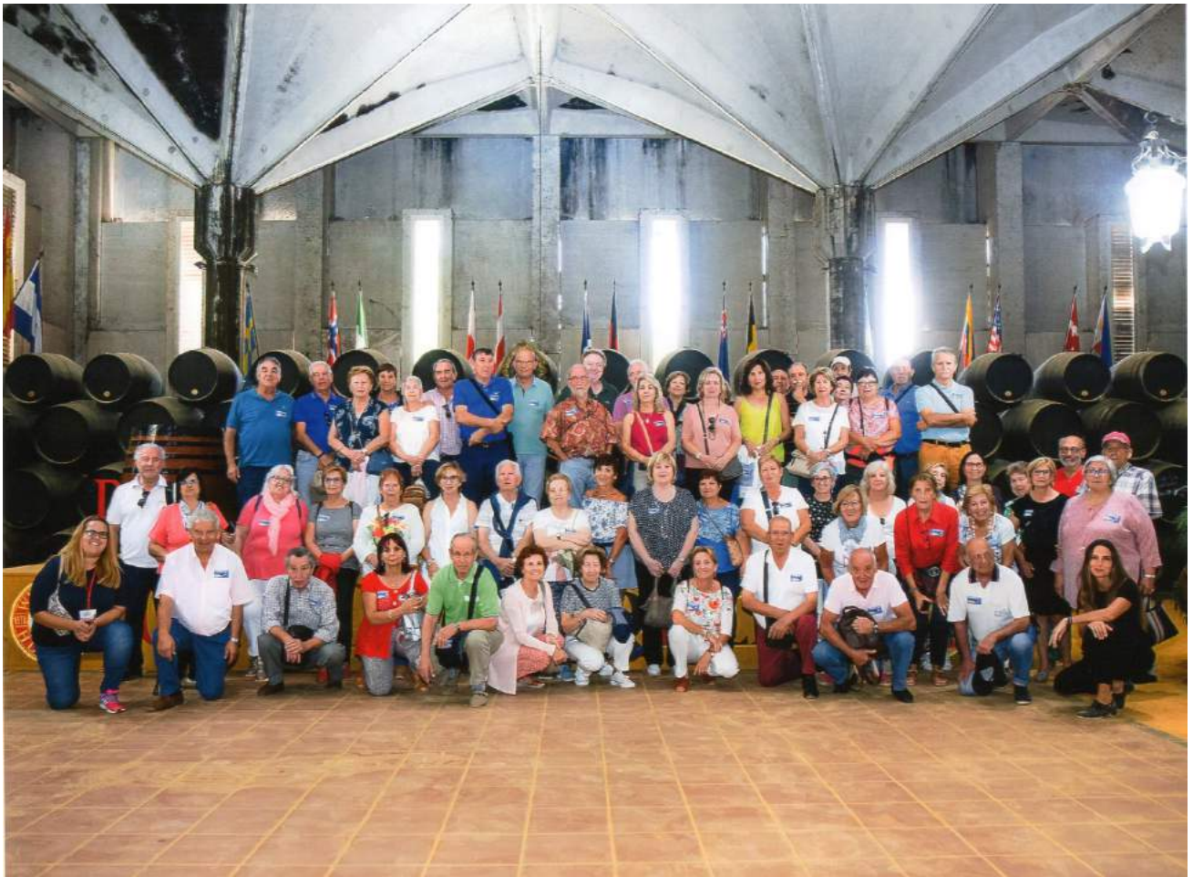
Visita a la bodega William &Humber en Jerez