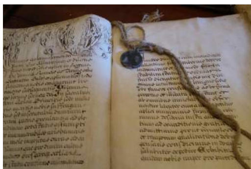
Bula Papal de León X

Desde entonces, los molineses adelantan la Navidad casi veinte días en el calendario, y se reúnen en familia para festejar esta tradición con un espíritu muy navideño. Se trata de una fiesta sencilla, sin mucho ruido, de esas que se viven de puertas para adentro de cada hogar.