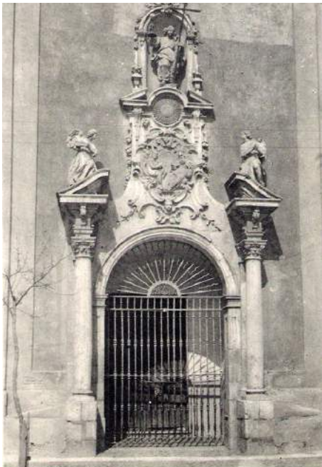
800 - GUADALAJARA. Puerta de la fachada de San Nicolás del Real