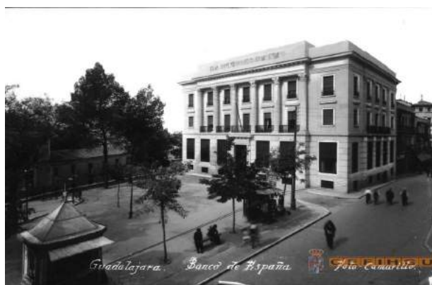
Banco de España, construido en 1934

A finales del siglo XVI un grupo de nobles trajeron a los jesuitas a Guadalajara, pero hasta 1619 no tuvo lugar la definitiva fundación, que corrió a cargo de la linajuda familia de los Lasarte. Después se abrió el colegio y el convento (1631) y la iglesia o capilla del mismo (1647). El primer rector jesuita fue el alcarreño Hernando Pecha.