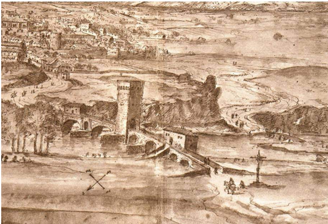
Dibujo de Anton Van de Wingerde, 1565, al final a mano derecha se aprecia el convento