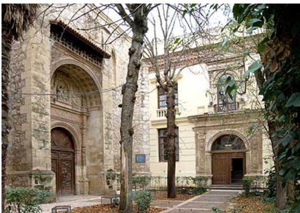
Fachada de la antigua iglesia, obra de Covarrubias

En su recuerdo se dio su nombre al Instituto de Enseñanza Media que ocupó durante un siglo, el lugar de su fundación y de su vida