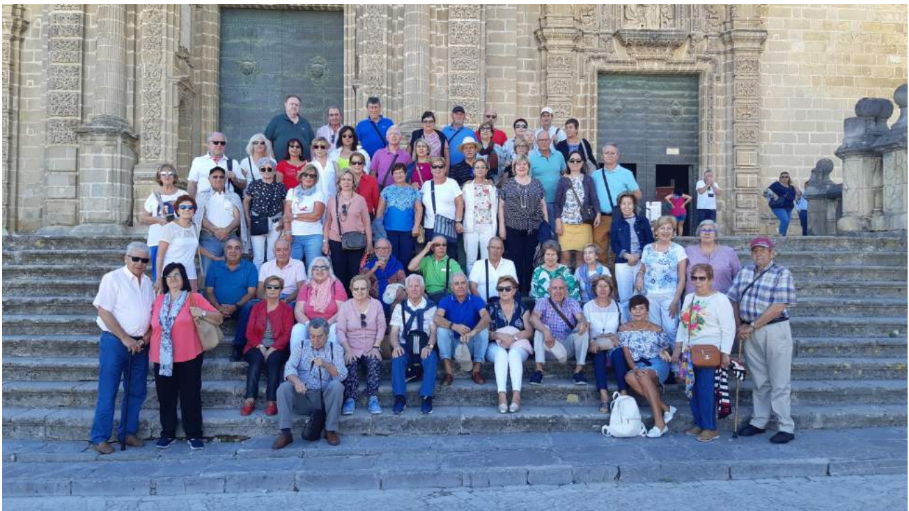
Catedral de Jerez de la Frontera