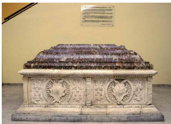
Sepulcro de D a Brianda de Mendoza