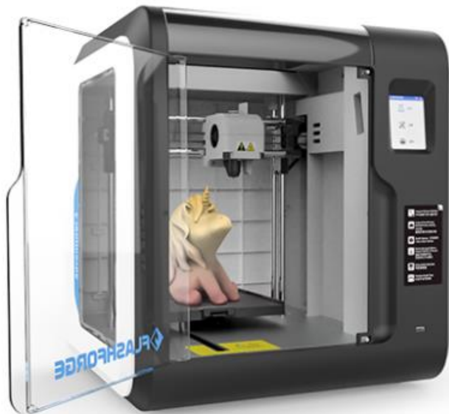
מדפסת תלת מימד – Flashforge adventurer

מדפסת מיני אישית מוצלחת וחדשנית בעלת טכנולוגיה מתקדמת