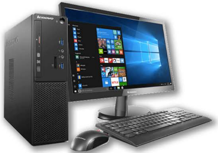
COMPUTER, MONITOR, TASTIERA, MOUSE

SISTEMA BREVETTATO DI TRACCIABILITÀ, DEI DEFUNTI MEDIANTE TECNOLOGIA RFID.