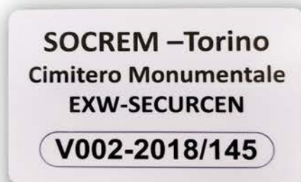
BADGE PER: OPERATORI, SALE, EQUIPAGGIAMENTI TECNICI, ECC.