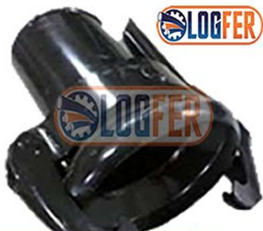
Engate de silo fêmea 3"