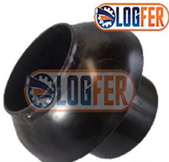
Conector macho para silo