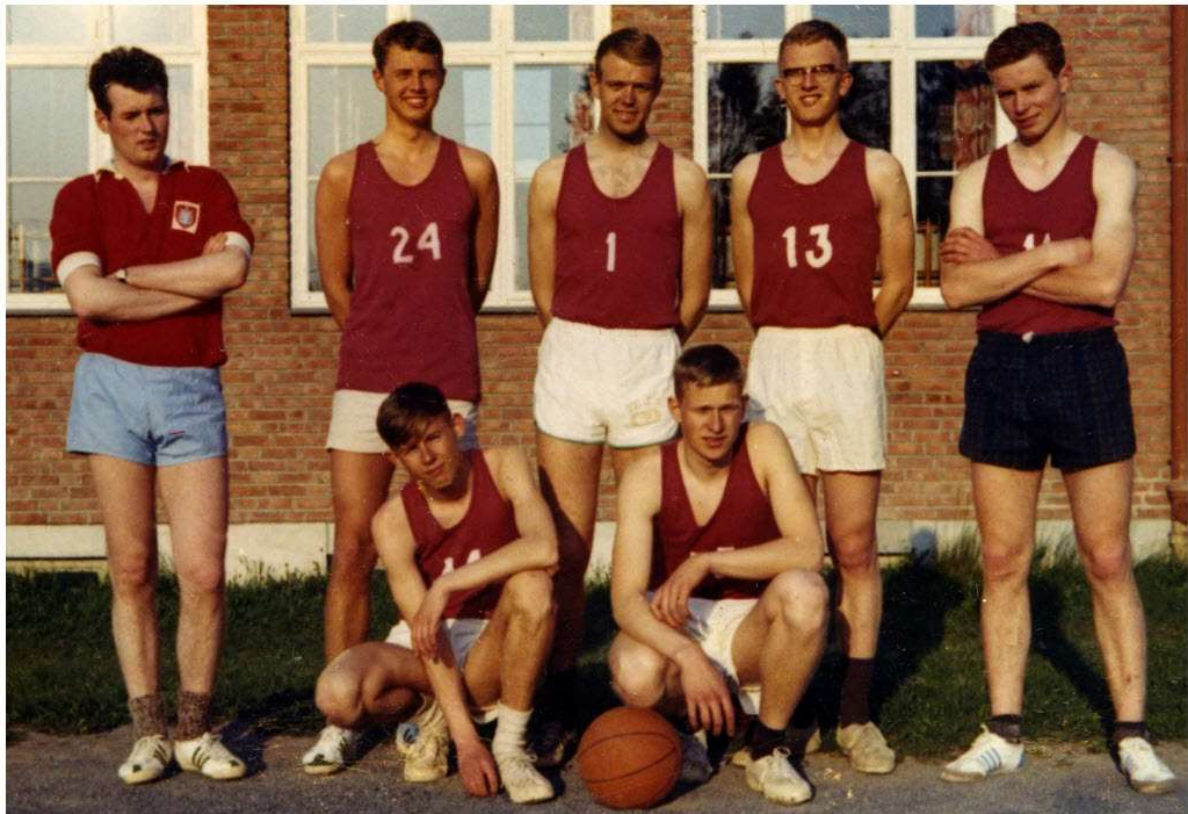
Askers første lag i 1972

Tusen takk til alle lag som har bidratt til at dette går an å gjennomføre!