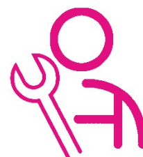
Konsultacje z mechanikiem

Utrwalisz zdobytą wiedzę zapoznając się z materiałami dydaktycznymi