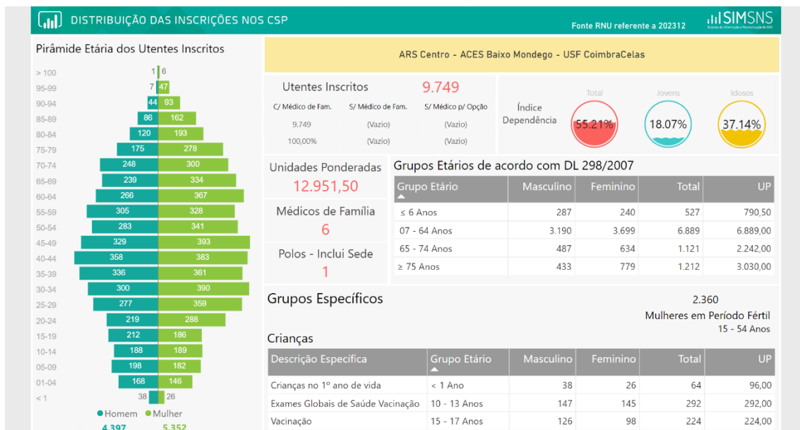
Figura 1: Dados BI-CSP 2023

Segundo os dados disponíveis no BI-CSP, referentes a dezembro de 2023, encontram-se inscritos 9.749 utentes na USF CoimbraCelas, correspondentes a 12.951,50 Unidades Ponderadas (UP), sendo 4.397 do sexo masculino (45.10%) e 5.352 do sexo feminino (54.90%).