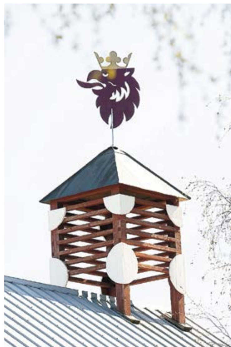
Det klassiska Saab-märket Gripen sitter högst upp i ett klocktorn på ladugården i Gullsjö.