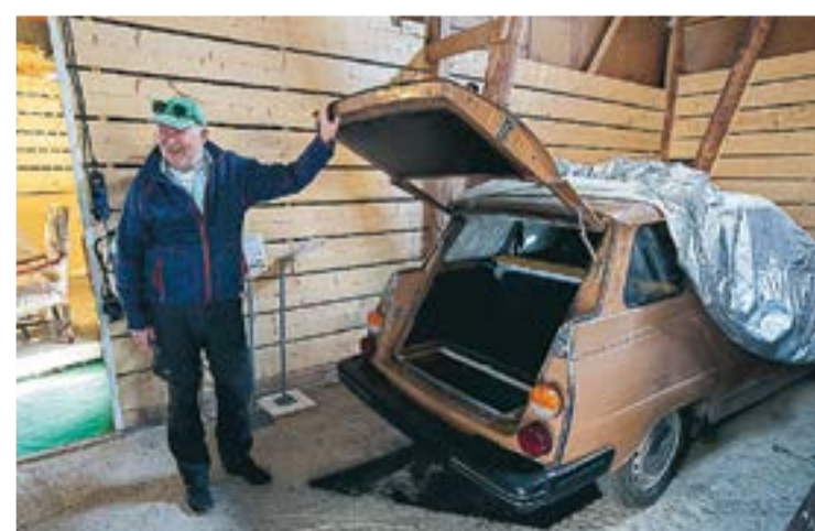
Den populära modellen Saab 95 med bakåtvänt säte finns i avdelningen för herrgårdsvagnar.

Tron Bach. – Det var inte mycket svenskhet i 9-5, de var lite mer amerikanska, så vi norrmän är väldigt stolta över att Saab-andan är tillbaka i 900-serien. Vid varje Saab-modell finns en skylt som berättar både fakta om bilen och dess historia. Invid 92:an, den första bilen i samlingen, står bland annat följande att läsa: "Hadde stått ute i 35 år, uten hjul. Biologisk mangfold grodd gjennom hele karossen, men fönstrene kunne fortfarande sveives opp og ned!" – Det är viktig å vite vem