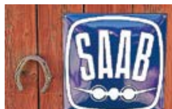
Entrén till Saab memorial hall i Gullsjö.

som har ägt den och vilken historia den har haft. Det är bilar som har haft ett liv.