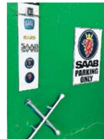
Bakom en dörr med ett fålgkors börjar visningen av Saab memorial hall.