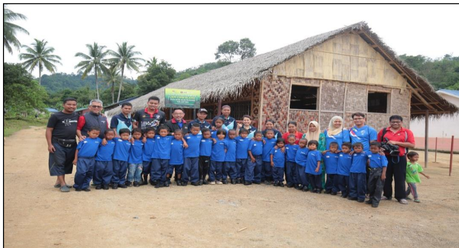
Rajah 3: Anak-anak Orang Asli bergambar bersama tenaga pengajar dalam kalangan belia Orang Asli dan penyelidik UKM di hadapan Pusat Pendidikan Komuniti UKM-CIMB Islamic di Pos Gob, Gua Musang

Penubuhan pusat pendidikan di kawasan ini bertujuan untuk membantu anak-anak komuniti tersebut mendapat pendidikan awal sebelum diserapkan ke sekolah aliran utama. Pusat pendidikan di Pos Gob ini menggunakan program berteraskan Literasi Alaf 21 yang dapat membantu anak-anak Orang Asli mengenal huruf serta membaca dalam masa tiga bulan. Menurut Manukaram et al. (2013), perkembangan dan tabiat pembelajaran anak-anak adalah lebih baik apabila ibu bapa mereka terlibat secara aktif dan berterusan dalam pendidikan mereka sejak awal lagi. Oleh hal yang demikian, belia dan ibu bapa komuniti di kawasan ini telah dilantik sebagai tenaga pengajar, tukang masak dan turut terlibat dalam pentadbiran dan pengurusan sekolah. Bagi memastikan kelangsungan usaha ini, seramai 8 orang belia telah dipilih dan dilantik sebagai tenaga pengajar, manakala satu jawatankuasa pemegang amanah telah ditubuhkan bagi mengawal selia perjalanan pusat pendidikan ini.