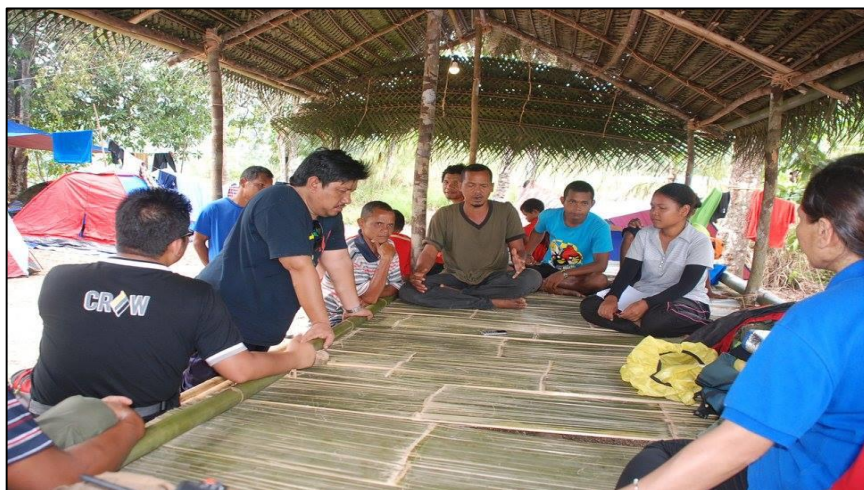
Rajah 2: Penyelidik UKM melakukan temu bual bersama penduduk Pos Gob

20 Mei 2017 sebagai Pusat Pendidikan Komuniti UKM-CIMB Islamic (“Sekolah rimba,” ms. 41).