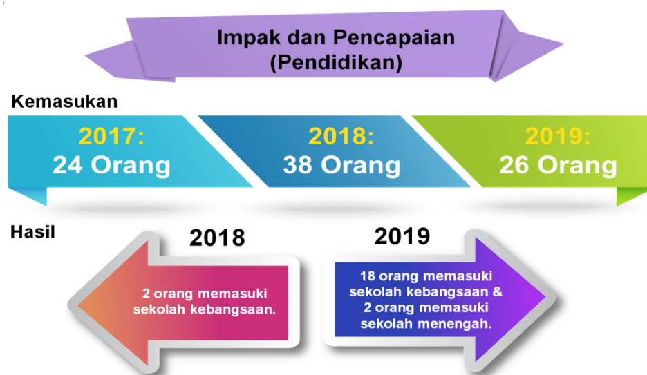
Rajah 5: Impak dan pencapaian murid Pusat Pendidikan Komuniti UKM-CIMB Islamic Pos Gob

menarik dan seimbang yang dilihat mampu mempengaruhi dalam peningkatan prestasi murid-murid Orang Asli walaupun proses tersebut memakan masa yang panjang.