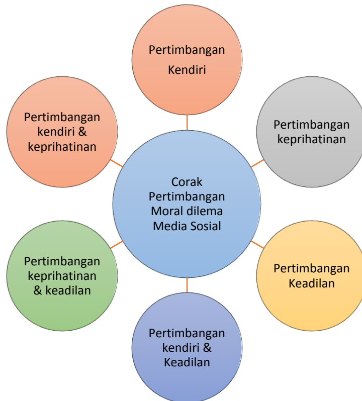
Rajah 2: Corak pemikiran moral dilema media sosial

Setelah temu bual berstruktur dijalankan, analisis telah dilakukan dengan menunjukkan terdapat enam corak pemikiran pelajar yang telah dikemukakan oleh responden yang dikaji. Antara corak pemikiran pertimbangan moral dilema media sosial yang telah dikemukakan oleh responden ialah pertimbangan sendiri, pertimbangan keprihatinan, pertimbangan keadilan dan corak pertimbangan gabungan seperti pertimbangan sendiri & keadilan, pertimbangan keprihatinan & keadilan dan pertimbangan sendiri & keprihatinan seperti pada rajah 2 di bawah :