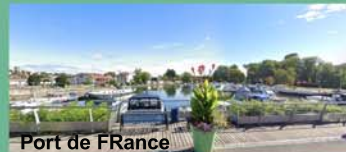
Port de FRANCE