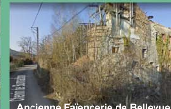
Ancienne Faïencerie de Bellevue (vestiges du four)