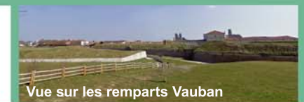
Vue sur les remparts Vauban