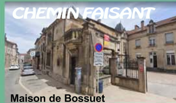
Maison de Bossuet