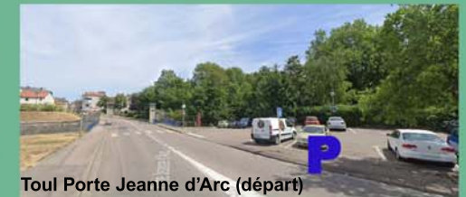
Toul Porte Jeanne d'Arc (départ)