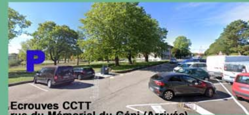
Ecrouves CCTT rue du Mémorial du Génie (Arrivée)

Nota : ce circuit peut être également parcouru dans le sens inverse au départ du siège de la Communauté de communes à Ecrouves