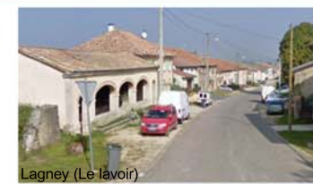
Lagnéy (Le lavoir)