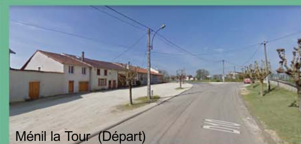
Méné la Tour (Départ)