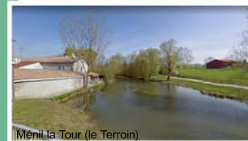
Méné la Tour (le Terroin)