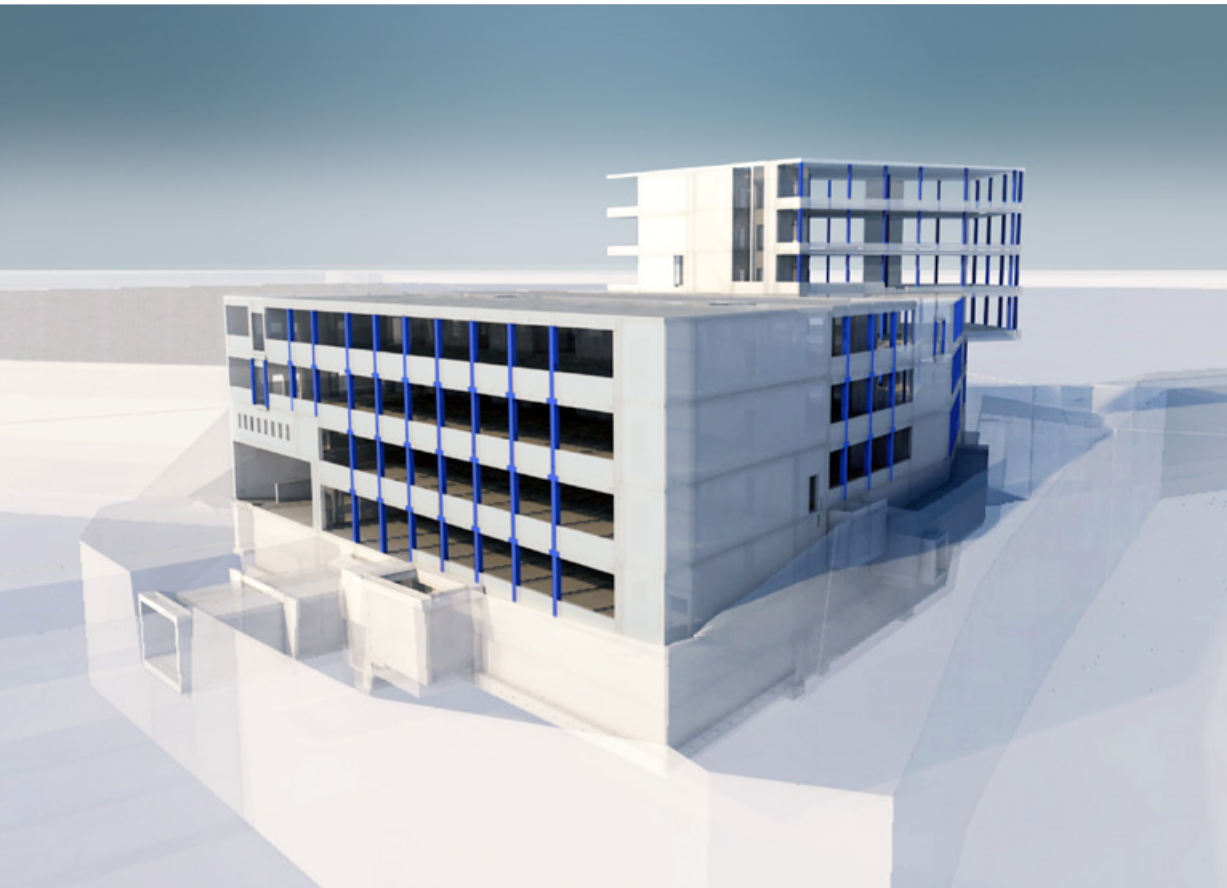
3D-Ausführungsmodell Neubau Werk 5, Thermoplan AG, Weggis