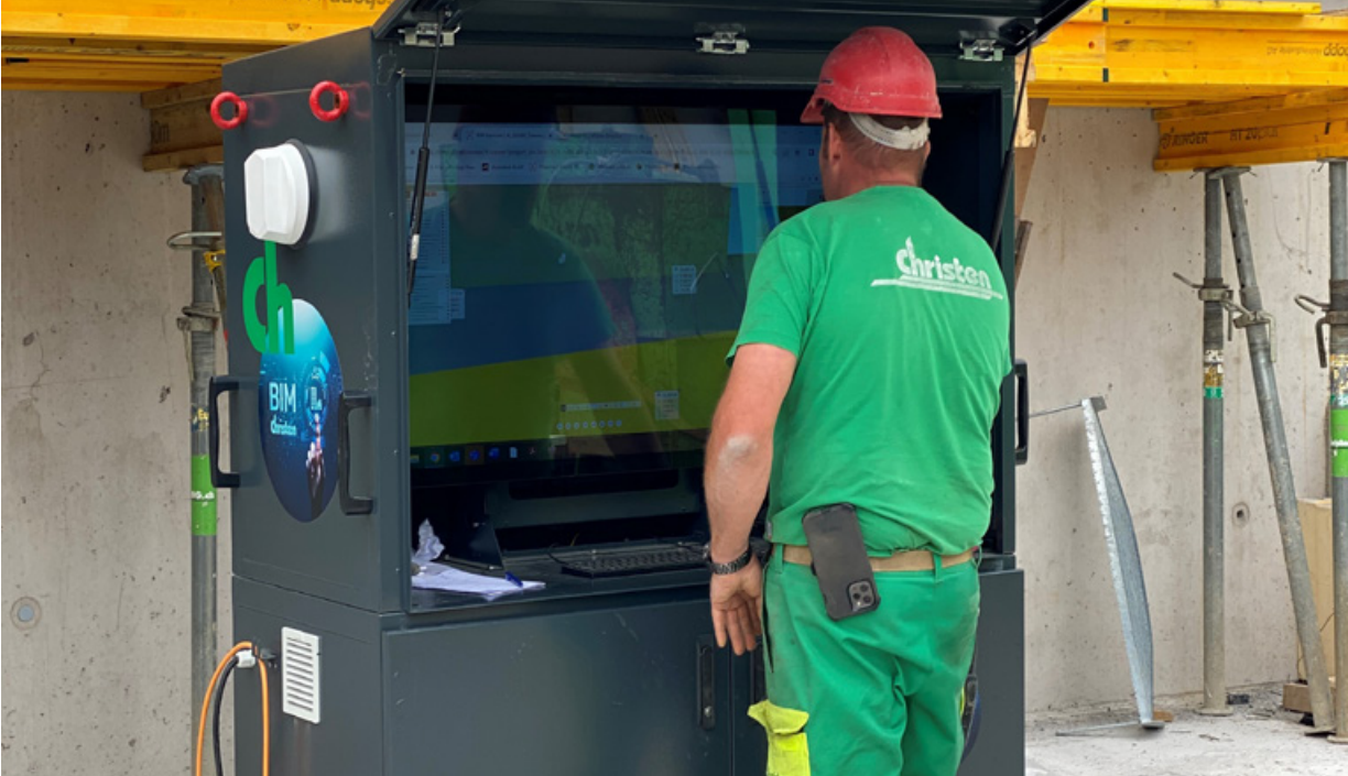
Digitales Planhaus auf der Baustelle