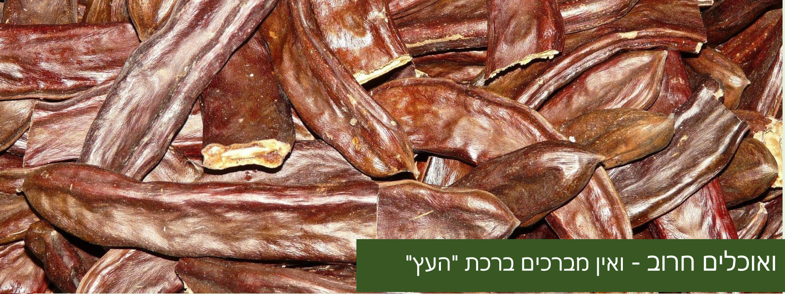
ואוכלים חרוב - ואין מברכים ברכת "העץ"