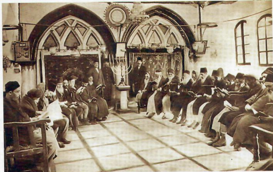
בית הכנסת הספרדי רבן יוחנן בן זכאי בעיר העתיקה בירושלים בצילום משנת 1927

דברים השתנו מאז? "היום יש יותר הכלה והבנה שיש לתת מקום לכל הגוונים, אבל עדיין אין מספיק העמקה בהגות הספרדית ולא רק ציטוט כעלה תאנה לדרך המקורות. הטקסטים הנלמדים הם כולם מתפוצה אחת. לא היה מקום להוגים ופוסקים ספרדיים. עולם שלם חסר. ההפסד הוא של התלמיד, אבל גם של הציונות